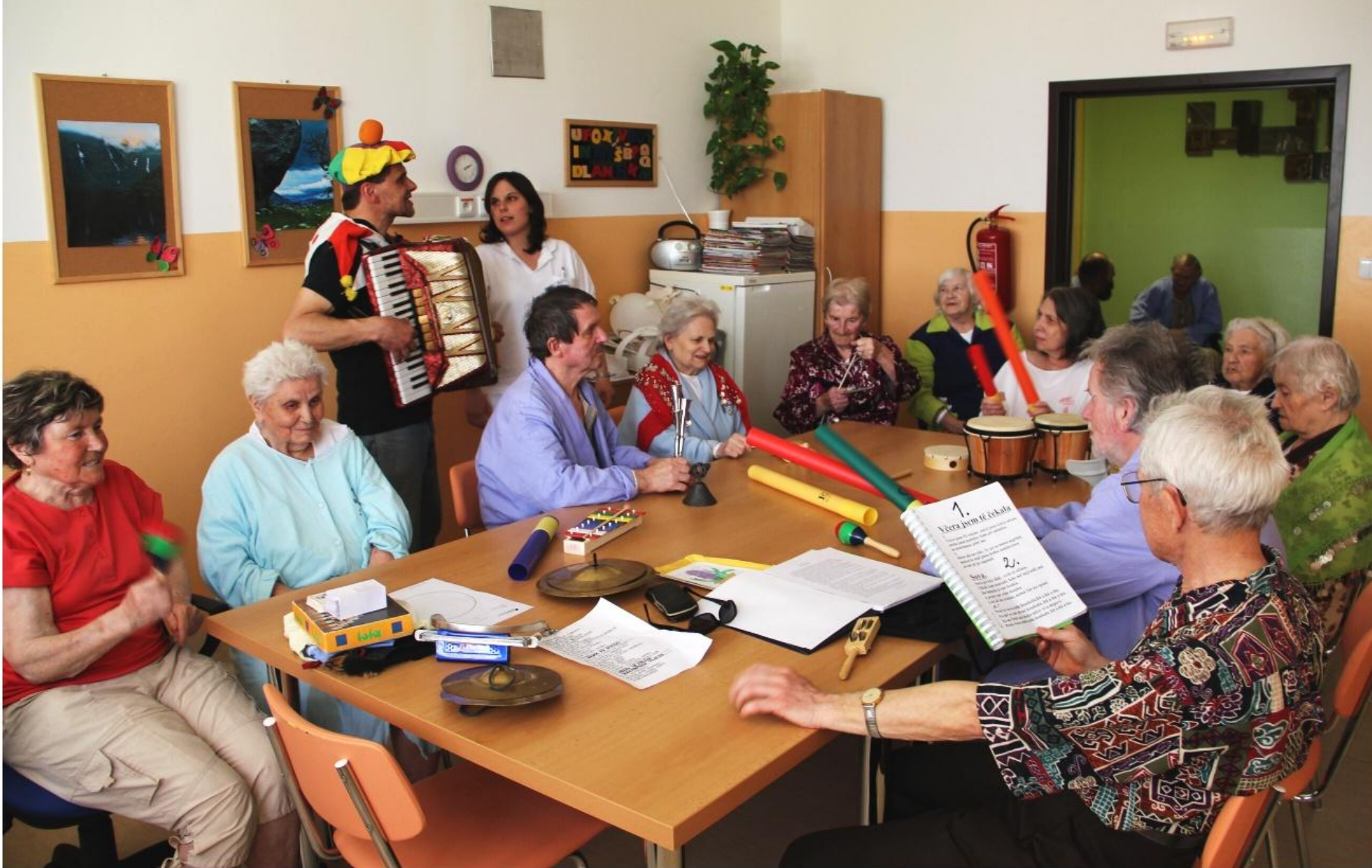
Náš dobrovolník – harmonikář na odd. LDN v nemocnici v České Lípě